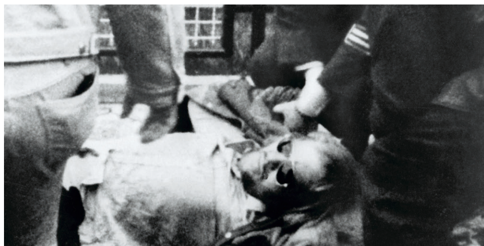
Andreas Baader, leder af Røde Arme Fraktion, arresteres den 1. juni 1972. Men nye terrorister er altid klar.